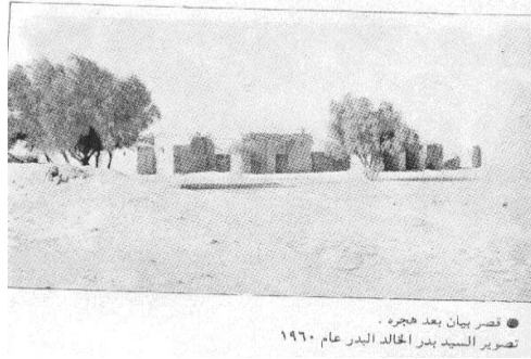
قصر بيان بعد هجره . تصوير السيد بدر الخالد البدر عام ١٩٦٠

وقيل : نسبة إلى رجل من العوازم يقال له حوالي بن مرزوق أبو قحطة المسحمي العازمي كان له فيها مزرعة وجليب ( بئر ) ، وقيل : بل إن حوالي بن مرزوق ولد في منطقة حوالي فسمي بها ، والله أعلم .