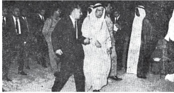
الشيخ عبدالله السالم وأحمد حسن البكر أثناء مأدبة العشاء في قصر الشعب

والشعب من الشعيب، وهو مسيل الماء، وهو وادي السيول المتدفقة من الأمطار.